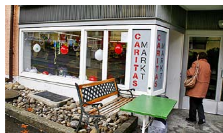
Caritas-Laden in Bern Extra zu Silvester hat das Personal das Schaufenster dekoriert.

► Laut Caritas sind 700 000 bis 900 000 Menschen in der Schweiz arm. 260 000 Kinder wachsen in ärmlichen Verhältnissen auf. Jeden Monat werden 1800 Menschen neu ausgesteuert. ► Die Armutsgrenze beim Einkommen lag 2006 bei folgenden Nettolöhnen: 2200 Franken für Alleinstehende, 3800 Franken für eine alleinerziehende Frau mit zwei Kindern, 4650 Franken für ein Ehepaar mit zwei Kindern.